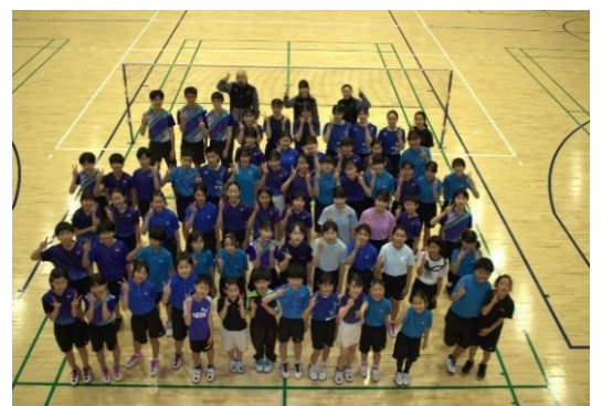
▲バドミントン：小学生~中学生対象