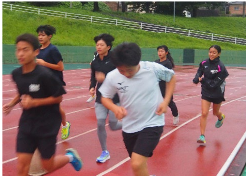
▲チャンピオン陸上教室：中学生～高校生対象

⇒小学生3～6年生対象、毎週木曜日 17時50分から19時30分、年間45回程度実施、鞆ヶ谷競技場、RiCイベント参加、各種競技会・大会に出場延参加人員 2500名