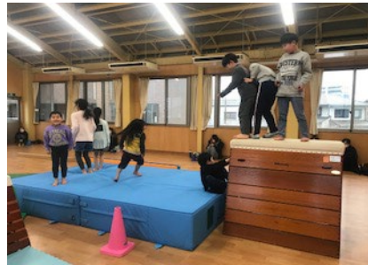
▲ちびっこスポーツ教室：年中～小学 4 年生対象

法人格を取得した平成 16 年に toto 助成で 2 階建てのクラブハウスを建ていただきその 2 階（多目的ホール）でいくつもの教室を行っています。（現在、成人教室 5 教室 子どもの教室 3 教室 成人サークル 3 サークル）