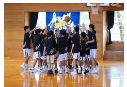
▲西国分ミニバスケット男子：小学 2 年生以上対象