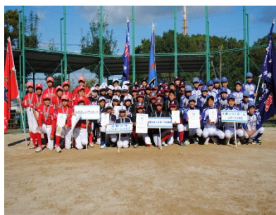
▲第17回ソフトボール交流大会 表彰団の集合写真