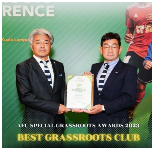
▲AFC スペシャルグラスルーツアワードにおいてベストグラスルーツクラブ部門で金賞を受賞

近年、OB・OGの子どもたちが入会し、活躍している姿を見て世代の循環を感じます。また、ユースチームやTOPチームの試合を応援してくれる子どもたちの姿をみて未来の明るさを感じます。この春日市という地域の中で、スポーツを通じて人々がつながり、関わった全ての人々が笑顔を共有できるような、百年、千年続くクラブを目指していきます。