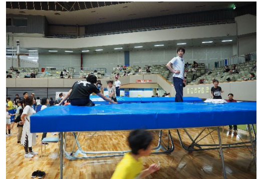
▲キッズチャレンジスポーツ Fesの様子(北九州市立総合体育館)

⇒18歳以上の成人対象、毎週木曜日 18時30分から20時、年間45回程度実施、鞆ヶ谷競技場他、北九州マラソン大会や市民マラソン大会に出場、延参加人員 900名