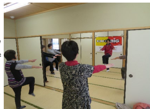
▲いきいき健康教室：大人対象

今後も当クラブを通じて子どもから高齢者まで、だれもが気軽にスポーツ活動に親んでもらえるような環境づくりを目指します。また、当クラブに参加される方々に、明るく元気に暮らしてもらうことを推進して活動を続けていきます。