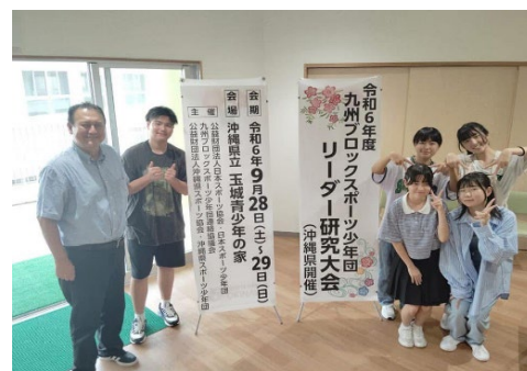
▲九州ブロックスポーツ少年団リーダー研究大会 福岡県団員・指導者の集合写真

期 日:令和6年9月28日(土)~29日(火) 場 所:沖縄県立玉城青少年の家 参加数:43名 (福岡県団員5名・指導者1名)