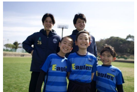
▲サッカースクール：小学生(1年生~3年生)対象

住居地域の近くで徒歩や自転車などで気軽に行ける範囲で活動中。Sportsを通じて、みんなで和気あいあいと楽しむクラブです。