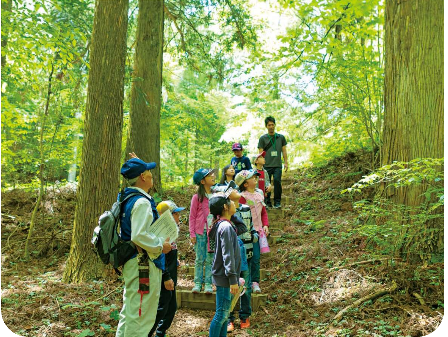
社有林「くじゅう九電の森」での環境教育

九電グループは、子どもたちの可能性を広げる、 さまざまな体験活動を行っています。