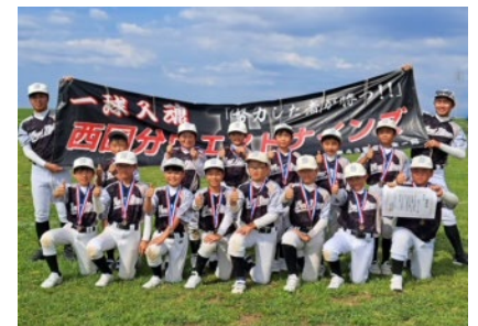
▲西国分ウエストナインズ：小学 2 年生以上対象

久留米市では、7 つのクラブが連絡協議会として毎月会議を行いながら、市や県の行政と連携し、30 万人の久留米市民のスポーツ・健康・生活ライフに関わるいろいろな方面でのお手伝いをさせていただいています。更に、ここ数年はパラスポーツでもある障がい者スポーツに力を入れ、体験会や教室等を行っています。今後、健常者も障がい者も一緒に活動できる共生社会や多大の垣根をなくした自由なスポーツ活動ができることを目指しています。今後、クラブが地域のみなさんにたくさん愛され、地域のみなさんたちの手で運営できるようなクラブへとになっていける様、願っています。