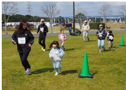
▲元気っ子マラソン大会の様子(北九州市立響灘緑地グリーンパーク)

⇒「だれもが、いつでも、気軽に」参加できる競技会をめざす。陸上競技の各種目の記録会を実施。参加人員 300名