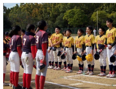
▲第17回ソフトボール交流大会の様子