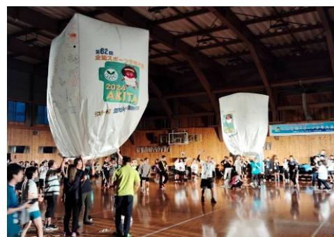
▲第62回全国スポーツ少年大会 野外フェスティバル(雨天のため屋内で実施)の様子