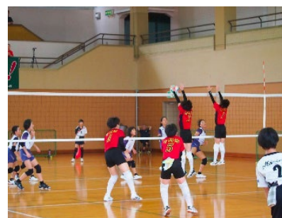
▲第18回バレーボール交流大会女子の部の様子

※女子の部優勝団は令和6年12月27日(金)～30日(月)に愛媛県で開催される全国大会に出場予定です。