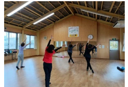
▲フレッシュエクササイズ教室：大人対象

鏡付きの多目的ホールでは子どもから高齢者まで健康を考えたヨガ教室や健康維持教室をはじめ子どもの体操やスポーツ教室を行ったり、高齢者中心の卓球やフォークダンス、社交ダンスなどのサークル活動とも連携しています。