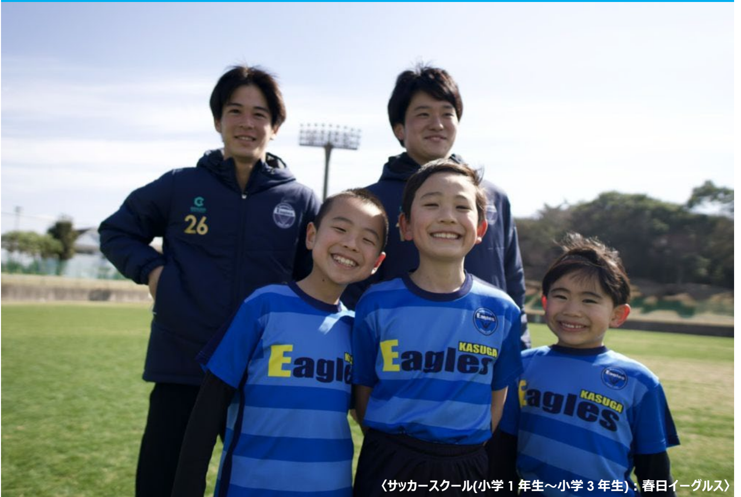
〈サッカースクール(小学1年生～小学3年生)：春日イーグルス〉