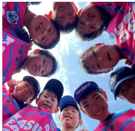
▲サッカークラブU12メンバー：小学生(4年生～6年生)対象

「社会課題の取り組み」; サッカーや多種目スポーツを通して不登校になった子どもたちに体を動かす楽しさや友達とボールを蹴る楽しさを伝えて、元気になってもらえるよう取り組んでいます。