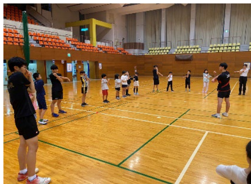
▲ニュースポーツ活動：小学生～大人対象

小学生～大人を対象に、ドッジビー等を行っています。ニュースポーツは、「だれもが、いつでも、どこでも、いつまでも、気軽に自由に楽しめる」スポーツです。