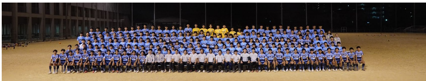
▲サッカーユース全チーム 集合写真