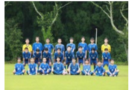
▲アザレア：Jr.～大人対象

toto 助成が終了したのち、他の助成事業や補助事業を行いながら活動を継続していきました。平成 21 年頃から県や国の委託事業を受けられるようになり活動が活性化してきました。その中で、今も継続されているのが「 小学校体育サポート委託事業 」となります。小学校の体育時間に指導者を派遣して、子どもたちの運動能力を高めるとともに体育が苦手な子どもを体育好き、スポーツ好きな子どもたちに増やすことのお手伝いをさせていただいています。現在八女郡広川町の上広川小、中広川小、下広川小、久留米市立の城島小、清峰小などに夏のプール指導やマット、跳び箱等の器械体操、ハードルや走り幅跳び・高跳びなどの競技を 1 年生から 6 年生まで先生方と協議しながら子どもたちが楽しめるようサポートしています。子どもたちが達成感を得たときの笑顔は最高のご褒美だと感じて指導しています。