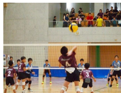
▲第18回バレーボール交流大会男子の部の様子