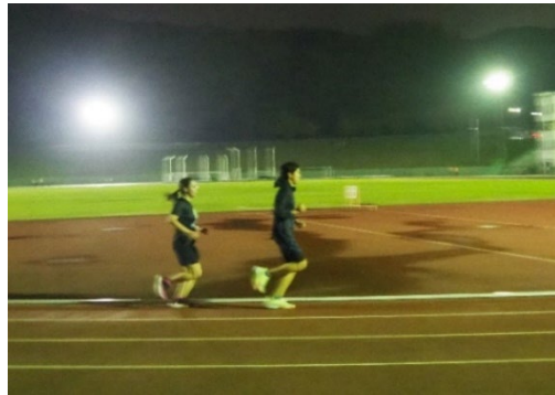
▲ランニング教室：18歳以上の大人対象