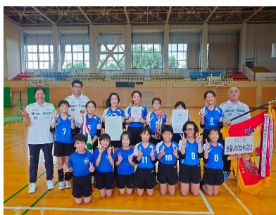
▲優勝した金島VBC はやぶさ2 (久留米市)