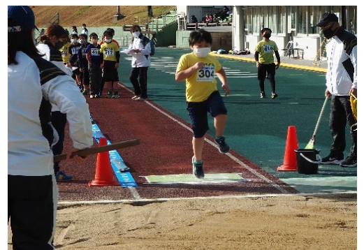
▲かけっこ Fesの様子(北九州市立鞆ヶ谷競技場)