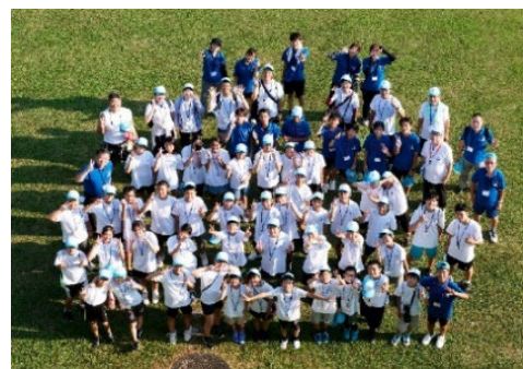
▲第56回九州ブロックスポーツ少年大会 参加団員の集合写真