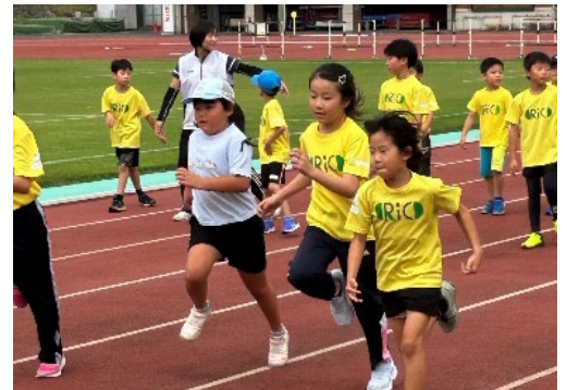
▲ジュニア陸上スポーツ教室：小学生(3年生～6年生)対象

⇒中学生・高校生対象(中学校の部活動の受け皿)、毎週木曜日 17時50分から20時、年間45回程度実施、鞆ヶ谷競技場、各種競技会・大会に参加 延参加人員 1500名