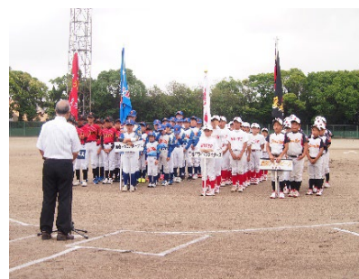
▲第46回軟式野球交流大会開会式の様子