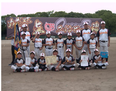
▲優勝した鳥飼クインビーズ (久留米市)