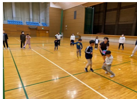
▲総合スポーツ教室：小学生対象

小学生を対象に、高校生の生徒たちが先生役になって走り方や球技などの様々なスポーツを通じて楽しみながら体力・運動能力の向上を目指しています。