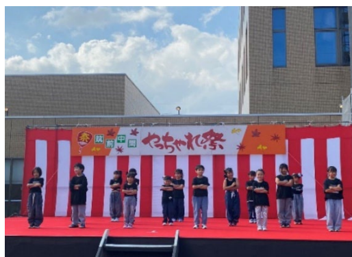
▲ダンス教室：5歳～中学生対象