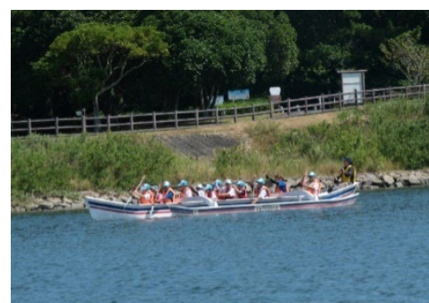
▲第56回九州ブロックスポーツ少年大会 カヌー体験の様子

期 日:令和6年8月10日(土)~12日(月) 場 所:鹿児島県立南薩少年自然の家 参加県:福岡県、佐賀県、大分県、宮崎県、沖縄県 参加数:44名 (福岡県団員10名・指導者1名)